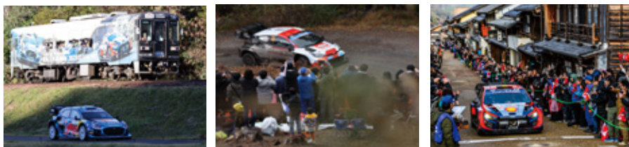
FORUM8 Rally Japan 2023

今年もまた、恵那市が開催地になります。ラリーカーは、チームスタッフが待機する「サービスパーク(豊田スタジアム)」を出発し、リエゾンに指定された一般公道を走り移動。恵那市内に設定される各SSで熱い戦いが繰り広げられます。リエゾンエリアでは、ゆっくりとラリーカーを見たり、写真を撮ったり。昨年参加した人も、はじめての人も、みんなで世界の走りを体感しよう!